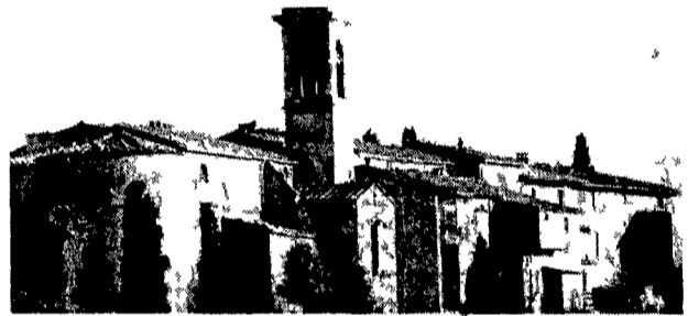
Peccioli Il borgo di Montecchio

in un territorio già attraente per le dolci colline (che hanno il pregio di produrre un Chianti famoso di origine controllata e garantita) per l'aria pulita e la cucina gustosa. Senza dimenticare i percorsi ecologici la possibilità dell'equitazione e della pesca sportiva. L'acquisto diretto dei prodotti della campagna tra i quali l'olio di queste parti merita il posto d'onore.