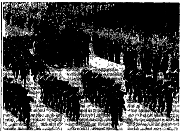
Aerei, carri e soldati per la parata ai Fori

BOLOGNA Diversi incendi hanno funestato quella che ieri era considerata la prima vera domenica estiva.