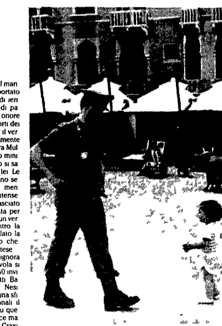
L'agente e il bambino

La pioggia che ha costretto il cerimoniale del ricevimento dei sette grandi a qualche imbarazzante allestimento tra le mura di palazzo Ducale a caccia di un luogo asciutto in cui poter recitare i riti dell'accoglienza.