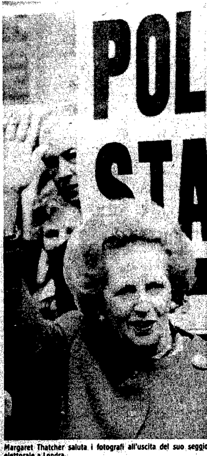
Margaret Thatcher saluta i fotografi all'uscita del suo seggio elettorale a Londra