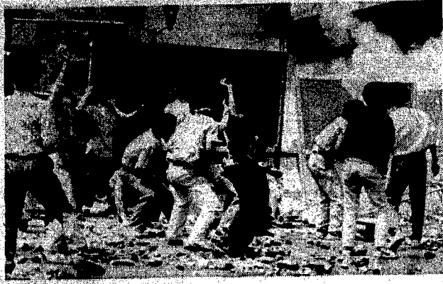
Continuano nella Corea del Sud le manifestazioni contro la decisione del presidente Chun Doo Hwan di nominare il suo collaboratore Roh Tae Woo candidato alla successione. Dopo i gravi incidenti di mercoledì con un gran numero di feriti tra i dimostranti e i poliziotti, ieri un migliaio di studenti si è riversato nelle strade di Seul scontrandosi con gli agenti che hanno lanciato contro di loro lacrimogeno. Nella foto un momento degli scontri.