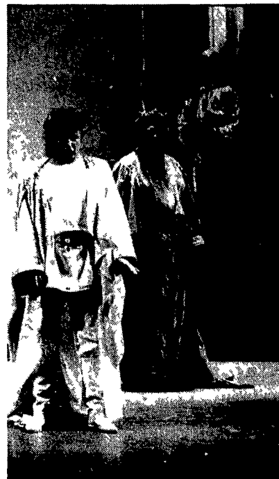
Una immagine del Lohengrin allestito dalla Fenice

Avendo così raccolto una buona compagnia all'estero la Fenice ha puntato le carte dell'allestimento su uno dei più famosi scenografi registri nostri Pier Luigi Pizzi. Un maestro del barocco un po' incerto nel mondo romantico come se visto in questo Lohengrin stentato. Rase al suolo querce e foreste. La vicenda è tutta chiusa in un cubo grigio dove tutto salvo la bianca casacca del protagonista ha il colore metallico del nichelino neogotico che rifanno Dührer con occhi pre-raffaelliti. È una Germania di ferro questa dove non basta l'apertura di una porta illuminata a restituirci l'illudibile tra i casti innamorati. Quel che manca qui nonostante gli ammaccamenti neoclassici è proprio l'atmosfera italiana che in tempi non lontani aveva fatto la popolarità del Lohengrin. Ciò non ha comunque limitato il successo assai caldo quando il teatro come s'usa qui è andato man mano riempendosi.