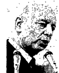
Gian Carlo Pajetta

qualche dato sulla partecipazione al voto. La prevista e temuta diserzione delle urne non si è verificata.