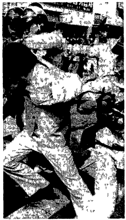
Un dimostrante arrestato dalla polizia durante gli scontri di ieri

Intanto la Corea del Nord continua ad evitare di commentare direttamente quanto sta accadendo oltre la linea di