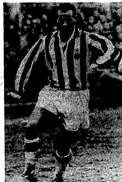
John Charles quando indossava la maglia della Juve e, nella foto piccola, in tempi recenti

celebre «cabezón» e anche il club Forza Juve di Hamilton, stanno progettando alcune iniziative, fra le quali una partita amichevole in suo onore. A questo proposito Charles fa un'implicita ammissione delle sue difficoltà. «Se lo faranno il ringrazierò di cuore. Se non lo faranno li ringrazierò lo stesso. Io non chiederò niente». E l'ipotesi di tornare in Italia? «Ho nostalgia del vostro paese dove ho trascorso forse, gli anni più belli della mia vita. Lì ho sempre tanti amici. Non è detto che in futuro non possa tornare magari per allenare qualche squadra. Ma adesso devo pensare al campionato canadese e a questo lavoro di direttore tecnico che sto svolgendo con grande passione e con notevoli soddisfazioni». Gli Hamilton Steelers stanno procedendo molto bene nel campionato. Ma in Canada le Leghe sono organizzate in maniera talmente aleatoria che nel breve volgere di un paio di mesi tutto può saltare per aria. Charles vive dunque in maniera dignitosa e soprattutto orgogliosa questa sua esperienza americana, ma in fondo il suo pensiero è sempre rivolto all'Italia, il suo primo amore. □ W.G.