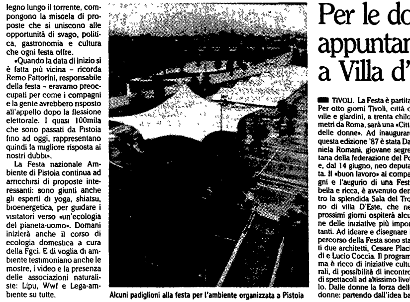
Alcuni padiglioni alla festa per l'ambiente organizzata a Pistoia