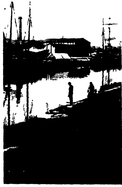
Il Canale Corsini a Ravenna in altri tempi