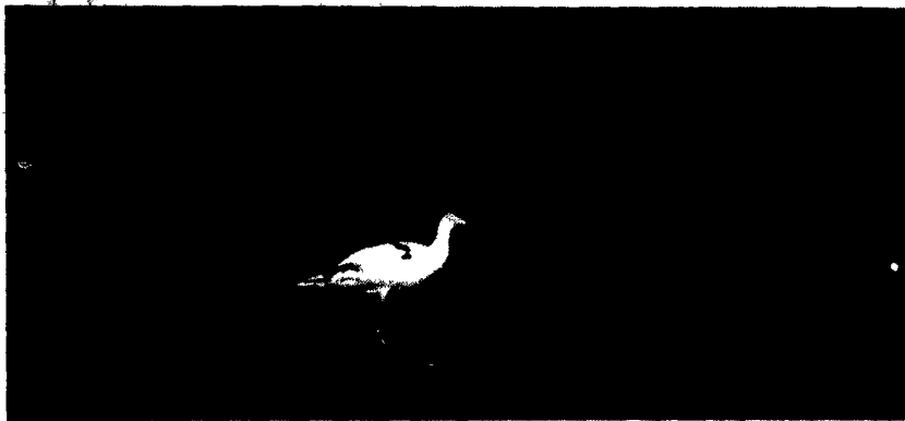
Un esemplare di avocetta, abitatore tipico delle Saline di Cervia