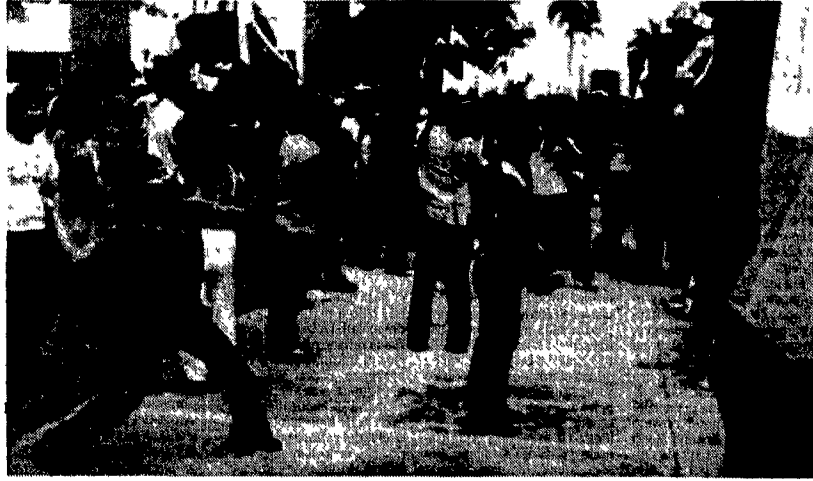
Un'immagine delle violente manifestazioni che in questi giorni stanno sconvolgendo la capitale panamense