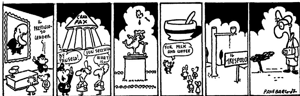
L'UFFICIO DI DE MITA