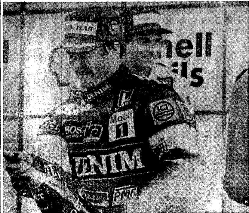
Mansell sul podio innaffia di champagne i presenti: dopo le Castellet un'altra vittoria per il baffuto inglese

Mansell e Piquet, l'altro pianeta in F1 Staccano tutti: alla fine vince l'inglese Anche l'Inghilterra boccia le Ferrari