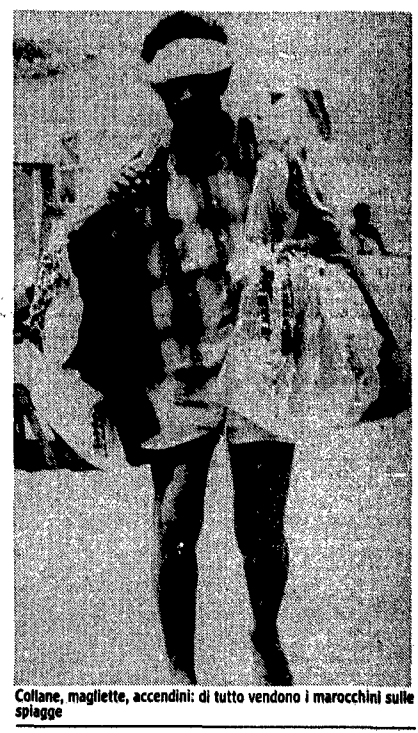
Collane, magliette, accendini: di tutto vendono i marocchini sulle spiagge

«Scusa amico, scusa, ma devo proprio correre, da questa mattina non ho guadagnato nemmeno cento lire. Come mai? «Convincere la gente è sempre più difficile, e poi noi siamo sempre di più, siamo tantissimi».