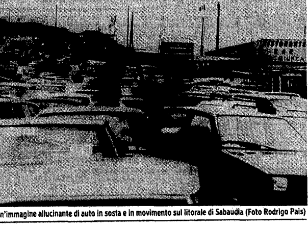
Un'immagine allucinante di auto in sosta e in movimento sul litorale di Sabaudia

SABAUDI. Da oggi a Sabaudia il mare è più caro. Si dovrà pagare il biglietto per parcheggiare l'auto sulla strada provinciale del lungomare. Per la prima volta durante l'estate viene attivato un servizio di parcheggio vigilato a pagamento, che interessa tutta la strada del lungomare.