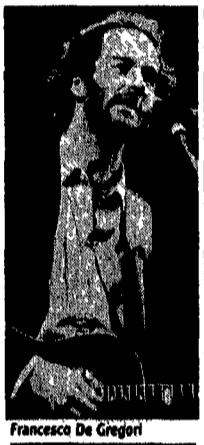
Francesco De Gregori