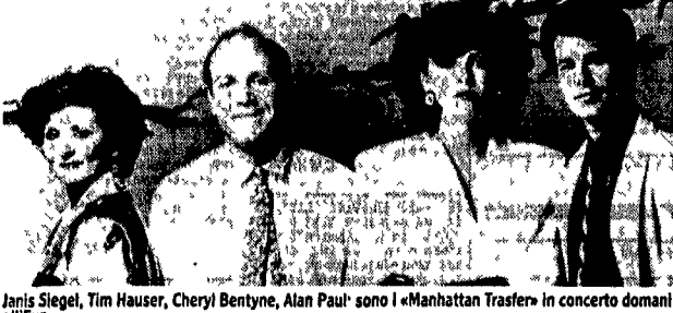
Janis Siegel, Tim Hauser, Cheryl Bentley, Alan Paul: sono i «Manhattan Transfer» in concerto domani all'Eur

Una guida per scoprire la città di giorno e di notte