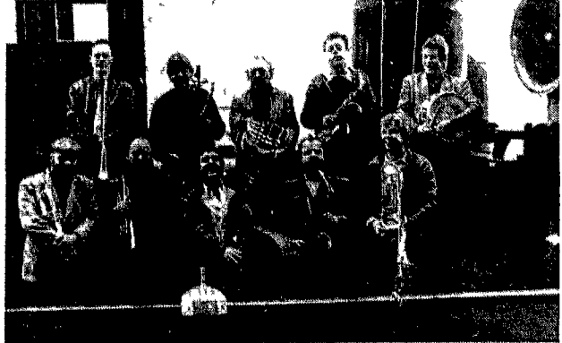
Il Willem Breuker Lellektief esegue mercoledì ad Atina la «Rapsodia in Blue» di Gershwin

logie secche entravano dai vetri e la sua testa era bagnata di pioggia. La pioggia le bagnò anche e gli occhi sorpresse e spense il tenero fuoco che vi si era acceso con i sogni estivi. Un aereo galleggiò su una scia bianca, tranquillo, finché scomparve dalla vista. Gianna cantò la voce calda e tremante acquistò sicurezza piano piano e divenne forte e lontana. Cantò il Tibet e la Luna, le profondità della Terra e tutte le persone. Finché tornò a lei come un passero in cerca di briciole. Alzò di nuovo la testa e guardò il cielo bianco di gelo e il vento (rettoloso freddo frustrante, incurante nella sua corsa del rami rincechiti e dei pochi raggi di sole. E Gianna si addormentò.