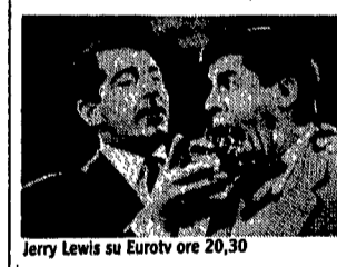
Jerry Lewis su Eurotv ore 20,30