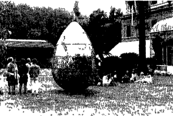
«L'uovo cosmico» esposto all'Orto Botanico nell'ambito di «Monuments & Music» di Brian Eno e Andrew Logan

Il risultato del lavoro dei due artisti è impalpabile come può esserlo un sentore un'atmosfera così poco concreta da suscitare anche qualche polemica durante la conferenza stampa sul valore dell'operazione. Ma basta apparentemente poco per realizzare quel tipo di arte che Eno ci descrive come tentativi di costruire un altro mondo di un nuovo modo di vivere diverso dai rumori del traffico e dalla fretta quotidiana.