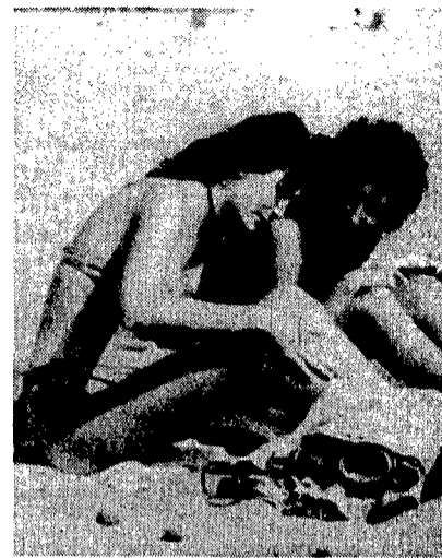
Pochi bagnanti sulle spiagge

vanno così - dice la ragazza che lavora da «Persichino» un ristorante alla foce di Rio Martino -. I soldi non ci stanno. La gente che viene al mare non spende. Si porta da casa anche la bottiglia di acqua minerale». «Sono cinque anni che vengo qui - aggiunge una signora ferma a un punto di ristoro - e la gente è sempre meno. Non è per il mare né per la spiaggia. Sono i soldi che non ci sono». «Qui proprio siamo messi male. Sono cento giorni che abbiamo il chiosco sequestrato. Vendiamo lo stesso qualcosa abusivamente. Sono quattro anni che stiamo qui e non riusciamo ad ottenere il permesso». Sono le parole di una ragazza quindicenne che a stento nasconde le lacrime. Più che a vendere sta lì a guardare che qualcuno non le rubi il posto.