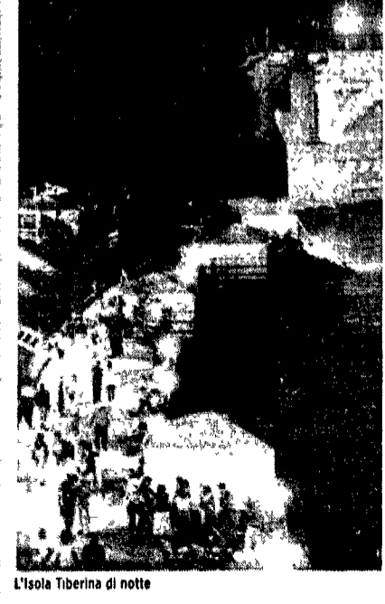
L'Isola Tiberina di notte

renziata. Le coppiette aggiungono quest'anno una nota di colore. Sembra che sia loro particolarmente gradita la fila di panchine sistemate lungo la sponda del fiume, che ricrea un'atmosfera simile a quella che si descrive una famosa canzone romana quando parla dei bacì che «fiocheno» sul lungotevere. La presenza dell'«isola» dice ancora Maria Giordano porta una voce originale nel dibattito sull'estate romana, con i suoi dati. 73 giorni di programmazione, un numero di spettacoli che si avvicinano a quello della programmazione estiva del Comune di Roma, ma con un budget di 800 milioni compresi gli allestimenti. Con in più il vantaggio della riciclabilità: le attrezzature non vanno perdute poiché l'Ente provvede a conservarle per le successive edizioni dell'«Isola» e per le sue attività annuali. Anche il prezzo