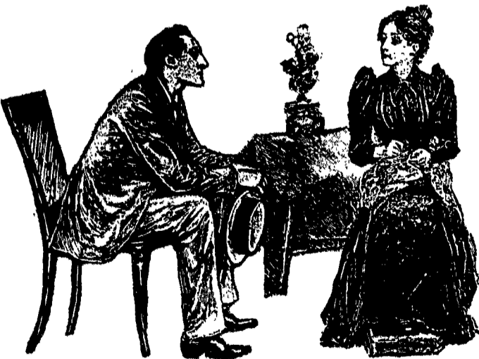
La signorina Cushing era seduta nella stanza principale dove fummo fatti entrare. Era una donna dal viso placido, dagli occhi grandi e dolci e dai capelli brizzolati che le formavano ala sulle tempie.