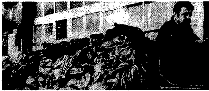
Sacchi di posta ammonticchiati nei corridoi del centro di via Marsala

re. Il parco furgoni è allo stremo: i mezzi sono vecchi, malcurati, con la carrozzeria a brandelli.