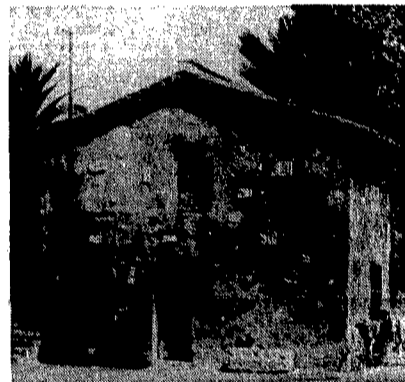
Una delle case all'interno del castello

Sedici anziani in balia del proprietario senza scrupoli in un pseudo ospedale e di altre due persone prive di qualsiasi competenza e specializzazione nell'assistenza sanitaria.