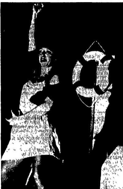
«Sogni di marinai» del Teatro Potlach: un gustoso viaggio attraverso le canzoni di Brecht e Weill