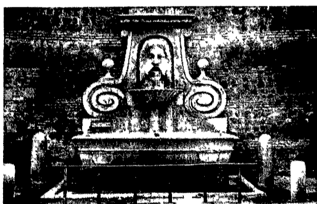
La fontana del Mascherone in via Giulia