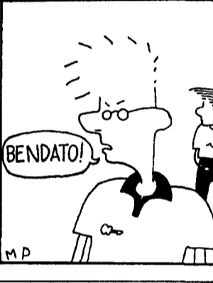
Zelig e il rock, firmato Petrella