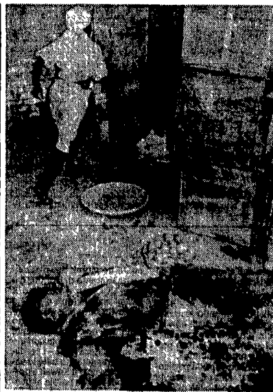
Un venditore di frutta ucciso al mercato di Port au Prince