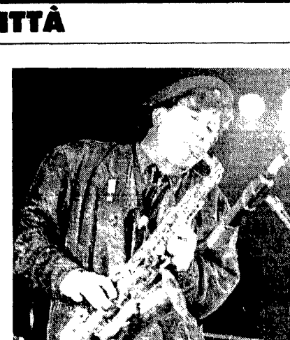
Enzo Avitabile stasera in concerto a Ladispoli

Per chi pensa «meglio soul», questa sera alle 21 al Campo sportivo di Ladispoli c'è Enzo Avitabile, il biglietto del concerto, organizzato dall'Assessorato alla Cultura del Comune di Ladispoli, è davvero contenuto, 6.000 lire. Se prendi il «soul express» di Enzo Avitabile, puoi fare una corsa nella metropolitana di New York, giù fino ad Harlem, e senza cambiare treno, volti l'angolo e ti ritrovi nei vicoli di SpaccaNapoli. Non c'è da stupirsi. Napoli è una metropoli nelle dove convivono la frenetica urbanità americana e l'«bassità» delle commedie di De Filippo. E non poteva che nascere in questo contesto, con queste immagini nella pelle, una musica come quella di Avitabile; ha il ritmo pulsante del miglior black soul di annata, ha l'ironia, l'allegria indovinata, il calore umano. Anche la consapevolezza; Enzo Avitabile è uno dei musicisti italiani più impegnati, magari un impegno che non passa direttamente attraverso i testi, ma nel coinvolgimento personale in tante iniziative. Dopo una lunga gavetta, in cui ha lavorato come sassofonista al fianco di molti grandi nomi napoletani, per Avitabile è giunto anche il successo da solista, col suo ultimo e più riuscito album, «Sos Brothers».