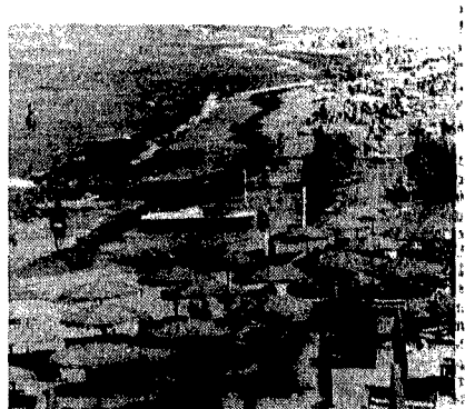
La spiaggia militare di Sant'Agostino

TARQUINIA ETRUSCO L. 3.500. Via della cascina, 32 Tel. 0766/856432. CIVITAVECCHIA GALLERIA Tel. 0766/25772. Luna di miele stregata di Gene Wilder, con Glisla Radner - BR (17-22.30)