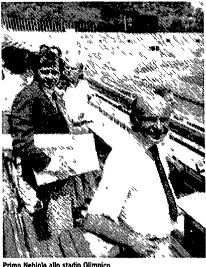
Primo Nebiolo allo stadio Olimpico

Raidue. Ore 13 25 Tg2 Lo sport, 18 25 Tg2 Sportsera, 20 15 Tg2 Lo sport Euro Tv. Ore 22 20 Catch, campionati mondiali maschili Tmc. Ore 13 Sport News, 13 45 Sportissimo, 19 30 Tmc Sport