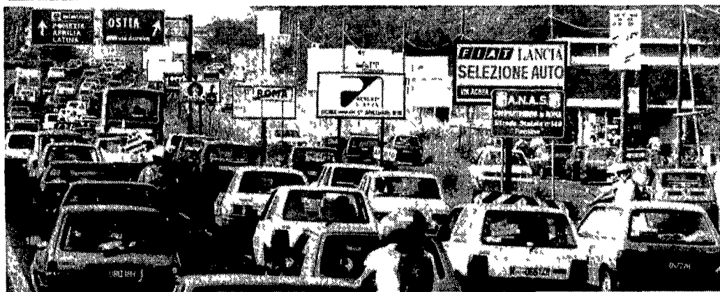
In fila verso il mare: per molti è l'unica (stancante) soluzione per prendere un po' di tintarella