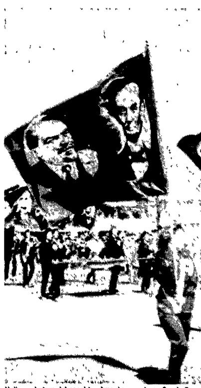
Un'inquadratura del serial tv «Amerika» presto su Canale 5

A vedere gli spezzoni presi qui e là, Amerika si rivela subito un lentissimo polpettone, che sacrifica ogni possibile dimensione fantascientifica a un messaggio insopportabilmente retorico, con grande sfoggio di volti ispirati e frequente ricorso alla bandiera a stelle e strisce. Gli sforzi di Berlusconi lavorano però alacramente e non è difficile pensare che ci mettano anche un po' di spirito commercialmente censuro, per cercare di smussare gli angoli più ferocemente sovietici di uno sceneggiato che non è piaciuto neanche agli americani. Figurarsi a noi italiani.