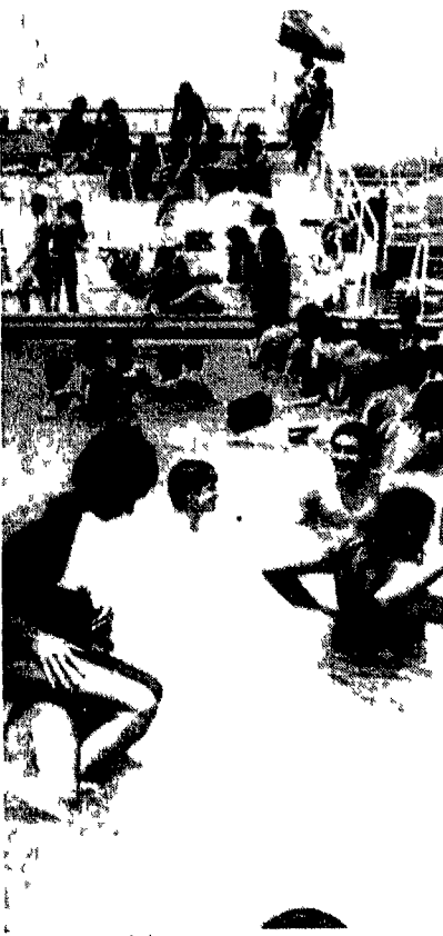
Un bel tuffo in piscina

Il battello ubriaco (Torvaianica) al chilometro 9.500 della litoranea poco prima del Villaggio Tognazzi. Pub discoteca con ingresso libero. Si beve una birra e si mangia un panino ascoltando (e se si vuole ballando) rock di quello buono dal Doors agli U2. La pista è a dieci metri dal mare.