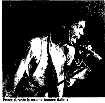
Prince durante la recente tournée italiana

È un'estate tutta a suon di rock, e la tv si adegua. Dee-jay Beach (in onda su Italia 1 alle ore 24) si replica domenica alle 14 rende omaggio al «caso del giorno», ovvero a Madonna, la cui tournée europea appare sui giornali a cadenze irrefrenabili. Il programma proporrà due video, il vecchio Material Girl (preistoria) e il nuovo Who's that girl, tratto dal nuovo film in programma altri video di recente successo.