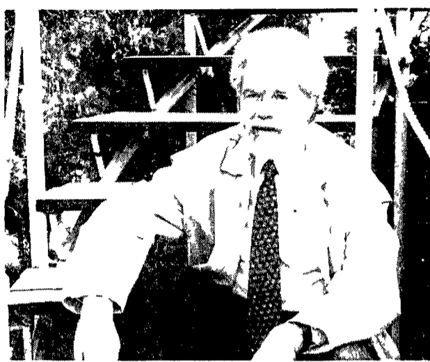
Il regista Luigi Squarzina