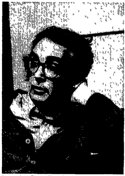
Il compositore Giacomo Manzoni

ve tecnica di scrittura e ispirazione tessono immagini di grande insieme. Per flauto solo anche Studio - variazioni di Luciano Chailly Flauto e chitarra si univano in Chardulna di Aziz Coghji e in Nana di Paolo Castaldi, un bellissimo pezzo che, composto nel '79, solo l'altra sera ha potuto avere la sua prima esecuzione. Il che lo dice lunga sull'insensibilità del nostro paese rispetto alla nuova musica. Anche la seconda serata dedicata ai tri non è stata da meno della prima. Mauro Castellano al pianoforte, Cro Scarponi al clarinetto, Augusto Vismara alla viola hanno restituito in pieno la nostalgia atmosferica di Scorcio di memoria di Francesco Pennisi e le invenzioni timbriche e ritmiche di In quella ubrazone , che l'autore Paolo Perezzi ha diretto personalmente in programma anche due pezzi di Sandro Corli ( Rondò per viola e pianoforte e Studi in forma di variazione per pianoforte) e Flores per