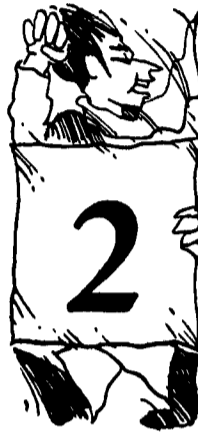
Profilo 2 MOVIMENTISTI

Animali politici in via d'estinzione ma mai ridotti in cattività siete voi i mitici veterocomunisti quelli che hanno attraversato pressoché integri un trentennio buono di glaciazioni e disgeli. I motivi che spiegano tale straordinaria resistenza all'evoluzione della specie sono due. Il primo, la costituzione fortissima basata su una spina dorsale ideologica ferrea. Il secondo, l'altrettanto rigida refrattarietà ai cambiamenti climatici e correntistici, nonché l'allergia totale per i compromessi Storici o quotidiani che siano.