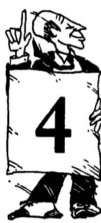
Profilo 4 NAPOLITANI

Ribellarsi è giusto, ma dopo aver chiesto il permesso. Comunisti nati, siete cresciuti nell'ombra protettiva della tradizione familiare e dell'organizzazione partitica venendo da lontano, ma guardando sempre più lontano ancora. Può darsi che a forza di elaborare strategie e di inseguire mediazioni il Partito vi abbia ricambiato, regalando un posto al sole. Ve lo mentate, ma state attenti a non scambiare, col tempo, il sole dell'avvenire con quello della nostalgia.