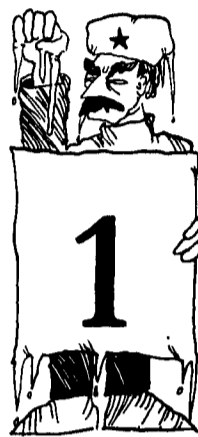
Profilo 1 COSSUTTIANI

Animali politici in via d'estinzione ma mai ridotti in cattività siete voi i mitici veterocomunisti quelli che hanno attraversato pressoché integri un trentennio buono di glaciazioni e disgeli. I motivi che spiegano tale straordinaria resistenza all'evoluzione della specie sono due. Il primo, la costituzione fortissima basata su una spina dorsale ideologica ferrea. Il secondo, l'altrettanto rigida refrattarietà ai cambiamenti climatici e correntistici, nonché l'allergia totale per i compromessi Storici o quotidiani che siano.