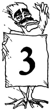
Profilo 3 OCCHETTI

Il Pci è piccolo per voi, troppo piccolo. Non per le dimensioni, intendiamoci, ma per quella macchinosità pachidermica che finisce per smorzare tutte le spinte creative, innovative e, perché no, rivoluzionarie, di cui vi fate portatori. Proprio perché vi sentite più comunisti di tutti, giovani, dannati, incazzati, negli ultimi tempi vi siete arrabbiati proprio col Partito, giustificando le eresie extraparlamentari e demoproletarie. In ogni caso, non si discute la vostra lealtà di fondo, e il modello del cuore non è il Figliol Prodigo, ma il Padre Ingraio.