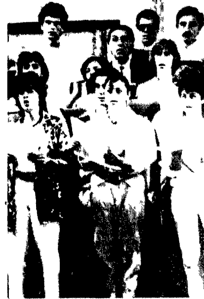
Il coro della scuola di Testaccio

evoluzione. Un'analisi storica di Testaccio presuppone campione di una scuola popolare di musica. Una scuola oltre alle considerazioni più generali e anche politiche sul significato ed ermo di tale struttura e sui contenuti e obiettivi proposti. Alla sua nascita la scuola di Testaccio ha praticato una diversa educazione musicale grazie anche ad un atteggiamento critico verso l'uso che della musica viene fatto dalle istituzioni e dall'industria culturale. Mantenendo fede alla denominazione «popolare» è cresciuta attraverso le numerose proposte didattiche e musicali, sui bisogni di studenti e insegnanti. Tuttora Testaccio non ha un terreno di sperimentazione e ricerca grazie all'indipendenza delle scelte degli insegnanti e rappresenta uno dei pochi luoghi aperti al confronto tra diverse tendenze culturali e musicali. E la carenza della discussione ne è stata. Con l'augurio che si apra a nuovi contributi e a rapporti dialettici con il vasto universo sonoro.