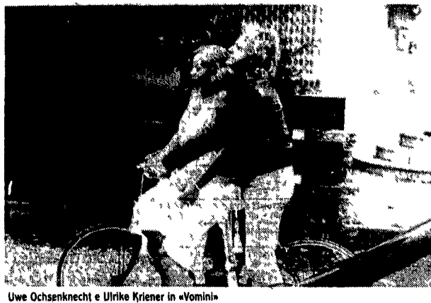
Uwe Ochsenknecht e Ulrike Kriener in «Vomini»