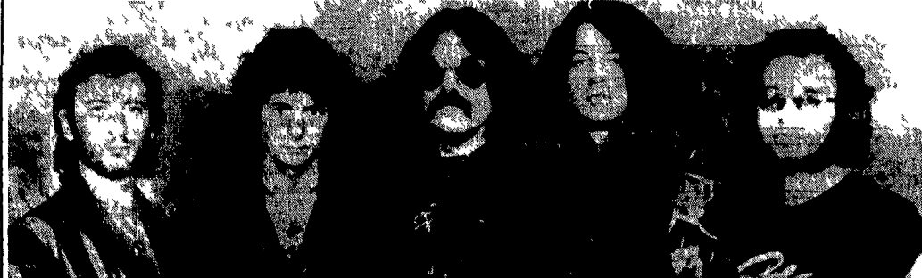
Deep Purple questa sera e domani al palazzo Civiltà del Lavoro

Oggi e domani alle 21.30 alla Scalinata del Palazzo della Civiltà del Lavoro Europa Deep Purple in concerto. Ingresso lire venticinquemila. Mentre a Torino l'Italia rende omaggio all'apparizione di Madonna a Roma sale sul palco di Entimia un vero mito del rock fatto per ben altri palati che non quelli educatori dei «madonnari». Parliamo dei Deep Purple: colonne vertebrale del hard rock, un gruppo leggendario formatosi verso la fine degli anni sessanta imperverarono fino al '73 anno della loro rottura vendendo milioni di dischi riempendo stadi ad ogni latitudine con uno show infuocato e durissimo come la loro musica. Resta a testimonianza di quegli anni un album live immortale «Made in Japan» che è anche il capitolo conclusivo di questa prima parte della storia dei Deep Purple. Il gruppo si era formato nel febbraio