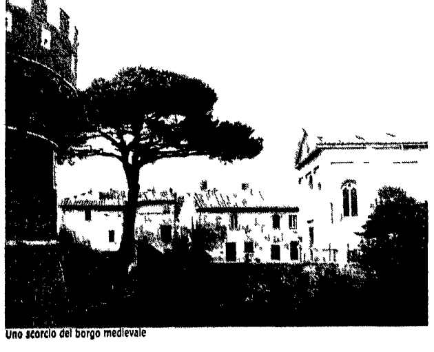
Uno scorcio del borgo medievale