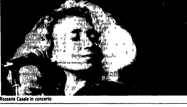
Rossana Casale in concerto

Questi gli altri appuntamenti della serata (oltre a quelli segnalati in tutta la pagina) Al Foro Italcro dove si sta svolgendo una rassegna di spettacoli vari (per il preciso ne allo stadio centrale del Tennis) ci sarà il concerto di Rossana Casale (L. 15 000 ore 21) un interprete anomala nel panorama musicale italiano che senza esitazioni sgarlano il ha puntato soprattutto sulla qualità della voce per cercare apprezzamenti da pubblico e critica. Il suo «pacchetto» di motivi va da brani originali creati per le sue corde a classici americani come la celebre Sitting in the dock of the bay del grande Otis Redding (che ha invece adattato alle sue corde).