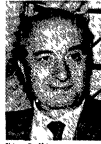
Ciriaco De Mita