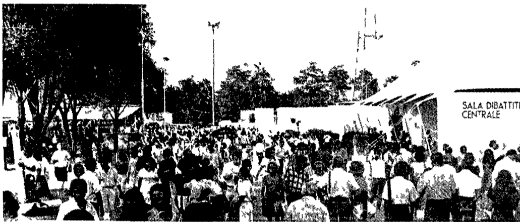
SALA DIBATTITI CENTRALE