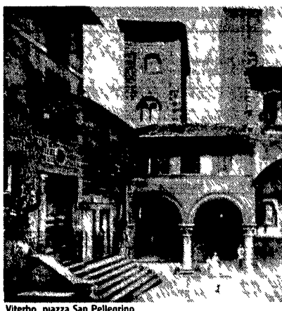
Viterbo, piazza San Pellegrino

cessità di far conoscere i suoi prodotti e al tempo stesso confrontarsi con altre realtà produttive Oltre a costituire quindi una iniziativa di carattere economico promozionale questa esposizione ne rappresenta anche lo sforzo di cogliere la possibilità offerta dal lavoro artigiano per capire la realtà socio culturale della Tuscia e delle province vicine Tutti i giorni tra l'altro nello spazio animazione i bambini possono starsene tranquilli a disegnare e poi partecipare al concorso di disegno (i premi sono previsti per tutti) che si tiene nell'ambito della mostra L'esposizione resta aperta dalle 15 alle 20:30 nei giorni feriali e dalle 10 alle 20:30 nei festivi