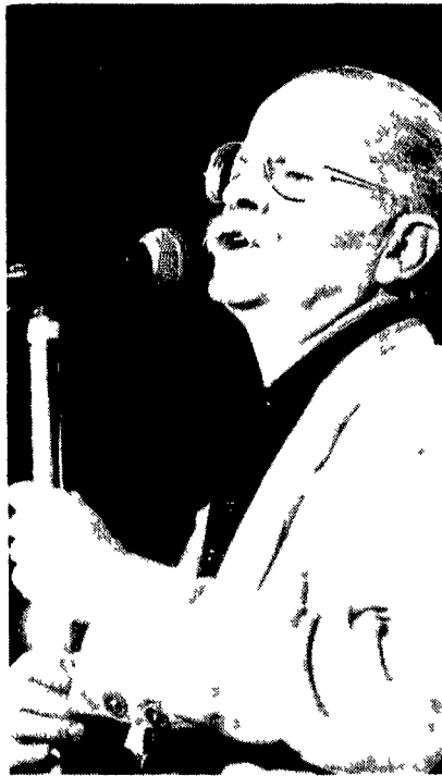
Gino Paoli stasera in concerto all'Eur

Lo spettacolo è basato sul nuovo lavoro playing del cantautore Cosa fatto da grande ma non mancherà qualche ritratto al passato remoto e prossimo Già a marzo Paoli aveva fatto una tournée in Italia portando un po' ovunque il successo che accompagna il suo nome Se lo spettacolo non è cambiato nel frattempo dovrebbe avere al suo fianco il gruppo dei Bandanà sei musicisti napoletani che lo accompagnano in questa sua escursione musicale All'epoca dichiarò alla stampa «Per la verità i vecchi pezzi in questo spettacolo hanno un senso preciso E come insieme parentesi in un discorso il discorso di oggi Non credo però che qualcuno si aspetti da me due ore di pezzi anni Sessanta altrimenti lo spettacolo si sarebbe dovuto chiamare Cosa ho fatto da piccolo»