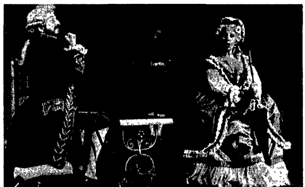
Una scena de «I finti commedianti» di Giuseppe Gioacchino Belli