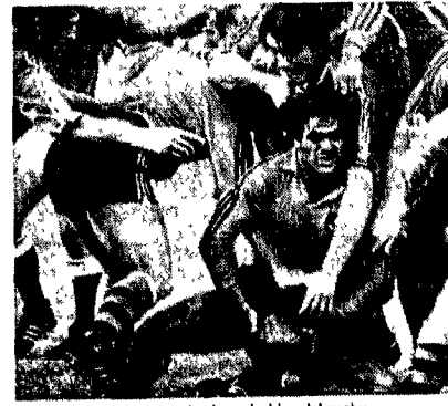
Si riaccendono da domenica le «mischie» del rugby