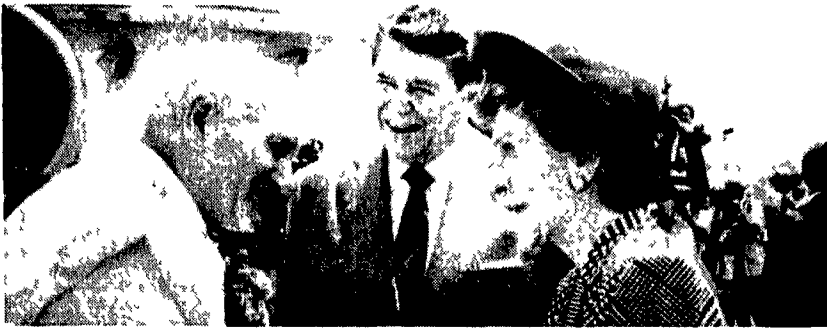
Il Papa a Miami con il presidente degli Usa Ronald Reagan e a la moglie Nancy