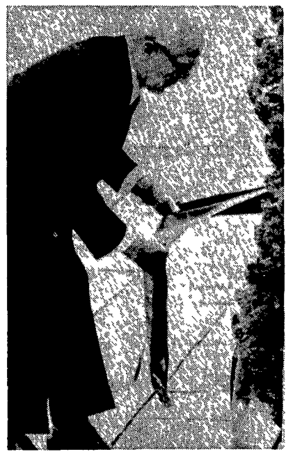
Honecker in visita a Dachau deposita una corona di fiori in memoria delle vittime del nazismo

Ieri mattina la stampa occidentale era galvanizzata da quella dichiarazione. Significa l'intenzione di rovesciare l'ordine di sparare sui transflugh?