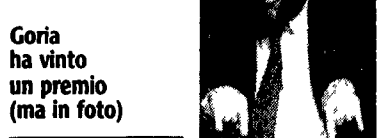
Goria ha vinto un premio (ma in foto)