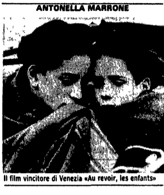
Il film vincitore di Venezia «Au revoir, les enfants»

La ricetta è quella di un piatto ghiotto che stimolerà l'appetito dei più curiosi amanti del cinema. Un pizzico del meglio dei migliori festival nazionali di cinema: Taormina, Pesaro, Venezia, due sale cinematografiche a Roma, un biglietto giornaliero a prezzo «politico» di lire 5.000, tre o quattro proiezioni quotidiane. È il Festival del Festival che parte domani organizzato dagli Assessorati alla cultura del Comune e della Regione e dalla Cooperativa Nuovo Cinema. La maratona di dieci giorni avrà due punti fissi nel cinema Rivoli e Labirinto, oltre settanta pellicole in versione originale con sottotitoli e un percorso «prestabilito»: dal 21 al 24 Mostra del Nuovo Cinema di Pesaro, dal 24 al 26 Taormina Arte, dal 26 al 30 Biennale di Venezia.