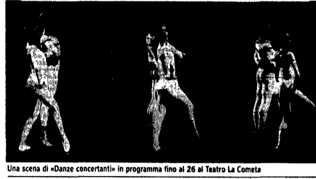
Una scena di «Danze concertanti» in programma fino al 26 al Teatro La Cometa