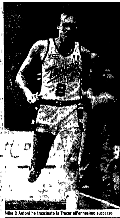
Mike D'Antoni ha trascinato la Tracer all'ennesimo successo

questo punto la macchina è competitiva. Ma abbiamo di fronte scuderie come Williams Lotus e McLaren che non stanno certo con le mani in mano e che dispongono di vetture di grande potenza e affidabilità