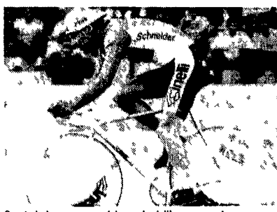
Oersted pluncampione del mondo dell'inseguimento