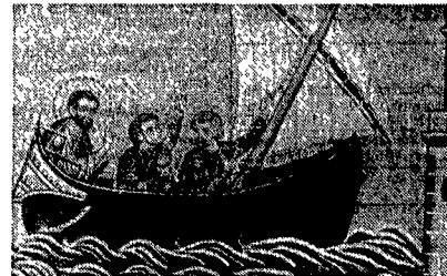
Uno dei mosaici di San Marco

ed esterni con la produzione di una multivisione a colori e di un volume stampato magnificamente dalla Electa e curato da Bruno Bertoni, Antonio Niero e Wladimiro Dorigo. I mosaici di San Marco formano un complesso narrativo e decorativo unico al mondo che in circa quattromila metri quadrati racconta l'Antico e il Nuovo Testamento e ci offre uno straordinario panorama di stili narrativi/costruttivi e di immaginazioni/mani di artisti e di botteghe di diversi secoli dal tardo antico e dal Medioevo fino ai rifacimenti cominciati col XVI secolo. Su questi mosaici hanno sognato artisti e studiosi di tutti i tempi; costruiscono un cosmo di colori, di forme, di Immaginazione inesauribile, una Bibbia in milioni di pietruzze preziose. Il gran bel libro della Electa, che muove dagli studi