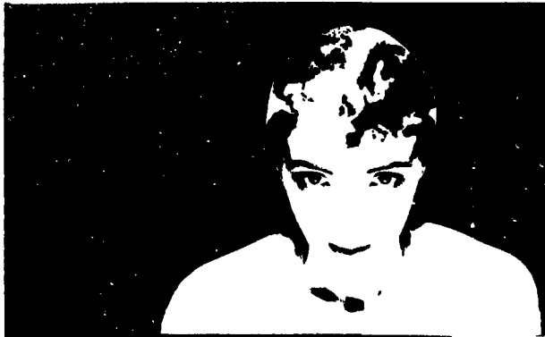
Particolare del manifesto della rassegna «Canale zero»