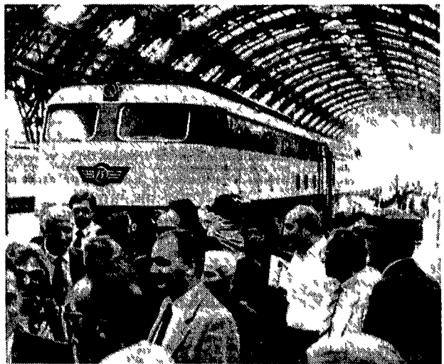
Passaggeri e tecnici all'arrivo del nuovo treno super rapido alla stazione centrale di Milano